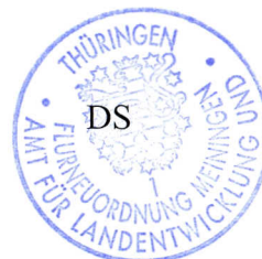
Knut Rommel Amtsleiter

Wird der Widerspruch schriftlich eingelegt, ist die Widerspruchsfrist (Satz 1) nur gewahrt, wenn der Widerspruch noch vor Ablauf dieser Frist bei der Behörde eingegangen ist.