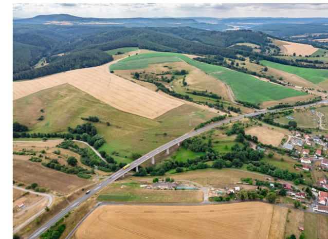
Ausgebaute Wege und Ausgleichs- und Ersatzmaßnahmen im südlichen Bereich des Flurbereinigerungsverfahrens mit Blick auf „Am Klingenberg“