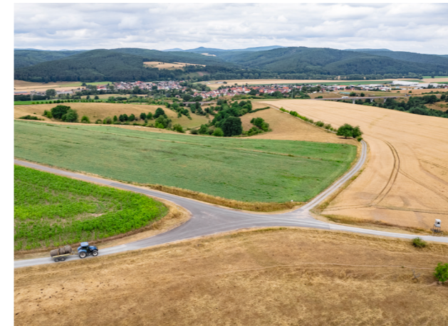
Die „Am Klingenberg“ aufeinandertreffenden Wege erschließen 7 Gewanne

Zur Kompensation von Eingriffen in Natur und Landschaft wurden 21 Ausgleichs- und Ersatzmaßnahmen durchgeführt. Diese Maßnahmen umfassten u.a. die Extensivierung von Grünland sowie das Pflanzen von Feldgehölzen und Baumreihen. Damit konnte das Verfahrensgebiet landeskulturell aufgewertet und ökologisch bereichert werden.