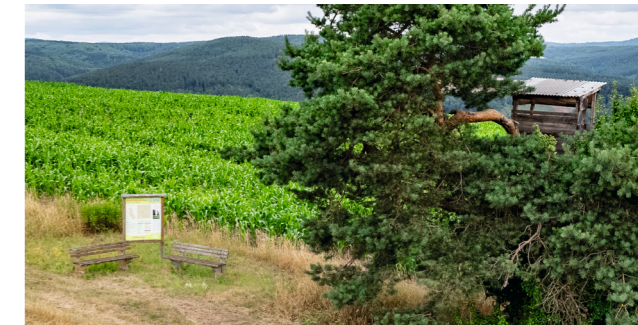
Sitzbänke am Ellenbergsweg

Am Grünbornsberg wurde eine Sitzgruppe aufgestellt. Am Ellenbergsweg laden weitere Sitzbänke zum Verweilen ein. Auch dies ist Teil der durch die Teilnehmergemeinschaft initiierten Maßnahmen.