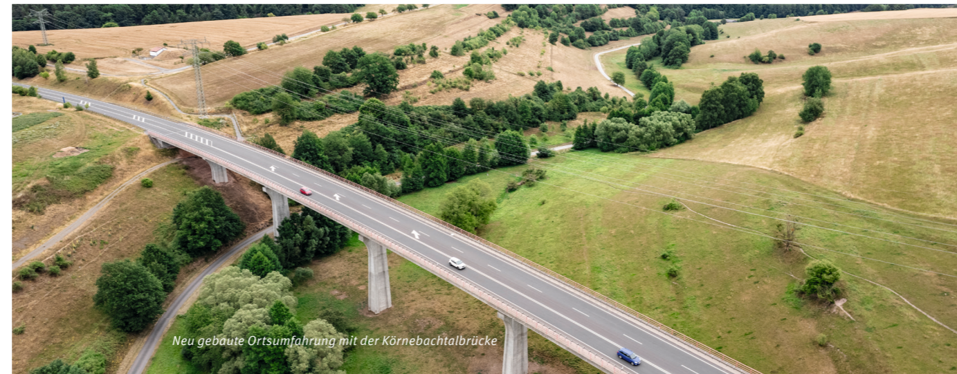
Neu gebaute Ortsumfahrung mit der Körnebachtalbrücke

Wegenetzes auf einer Länge von über 10 Kilometern. Damit wurde die Erschließung der Landwirtschaftsflächen erheblich verbessert. Mit dem Neubau eines Regenrückhaltebeckens wurde die Straßenentwässerung gesichert.