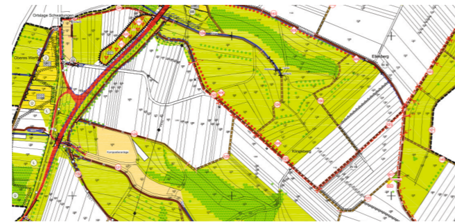
Ausschnitt des Wege- und Gewässerplans im Bereich von Ellenberg und Klingenberg

In enger Zusammenarbeit mit dem Vorstand der Teilnehmergemeinschaft wurde ein Wege- und Gewässerplan aufgestellt. Dieser bildete die Grundlage für eine Erweiterung und Erneuerung des